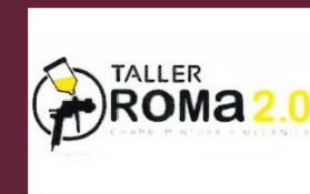
Taller Roma 2.0