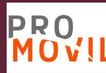
Grupo Promovil - Grupo Distribuidor autorizado ORAGE